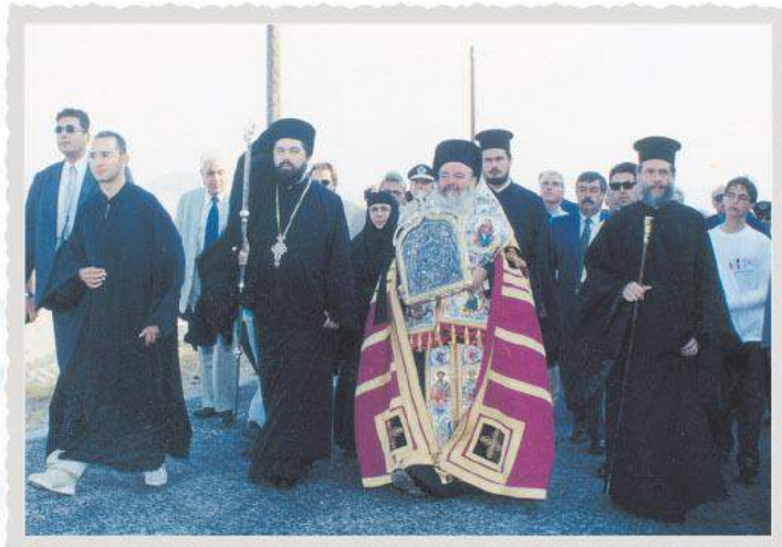
Άνοδος Αγίας Εικόνας (23 Ιουλίου 2000)

Για πληροφορίες Π.Ι.Ι. ΕΥΑΓΓΕΛΙΣΤΡΙΑΣ ΤΗΝΟΥ Τηλ.: 22830.22256 Σχεδίαση - εκτύπωση: ΤΥΠΟΣ Τίνος, 84200 • Τηλ.: 2283.025.727 • www.typos-press.gr