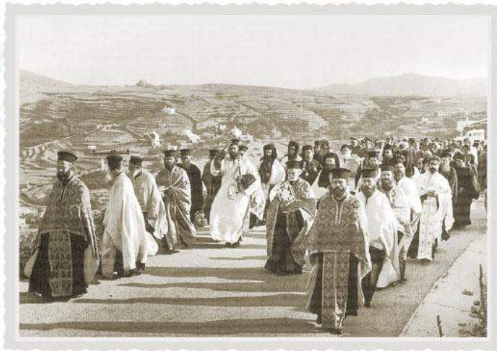
Άνοδος της Εικόνας της Μεγαλόχαρης, ημέρα καταιάξεως της Αγίας Πεδαγίας στο ορθόδοξο αγιοδώγιο. (23 Ιουλίου 1971)