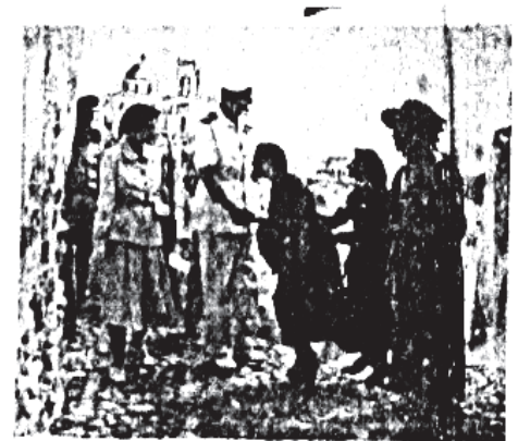
Ἐπιμετρία ἡλιακῶν Με... Ἐπιμετρία ἡλιακῶν Με... Ἐπιμετρία ἡλιακῶν Με...