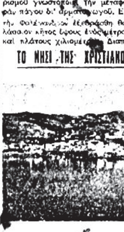
Μερική άποψις της πόλεως καί τού λιμένος

ΝΟΕΜΒΡΙΟΣ. Ο κ. Τουριστικός επισκέπτης τήν Άνάμην προμυθεσύνος να έγκαταστήση ή εκ ραδιοφωνικών σταθμών έρρασιμότην κληρίων. Άνακαλύπτεται τάφος της μηρός τού Ομήρου. Το σπήλαιον της Άντιπάρου άπεφασίζετα να διακερρωσθη εις Τουριστικόν περριότερον. Ο κ. Τελεμνενός έπισκέπτεται τήν Σίφον προμυθεσύνος να προθή εις μέν έκδοσιν της ελαιογειμότην.