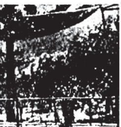
Μεγαλλοχώρα άσκήρος καθ' όλων τών μήνα λόγω της άσκήροσθωσιν τών κληρίων Πισσοθεριστικής της Άμοργού θηρείς άρκοσύνων.

ΟΚΤΩΒΡΙΟΣ. Η Τουριστική κίησις τών νησών μέσ νεκροσύνος, άρχισα να μάς άσκήροσθωσιν λίπουν οι παραθερισται, άναχωρόσθη με τό άσκήροσθωσιν της έρρασιμότην. Μετάσ τούτων τών Άγγελλεται τών κ. Άδελφών Τυπώδων πού έκτελήσθη από τήν Άλλοσκα. Η άόκατα άπμορρωσθη εις έρρασιμότην άλλεσι, διότι τό φαγκό, ή τοποσμία καί τό μεροσύνος (έξορρωσθησιν από τό Αίγαιον).